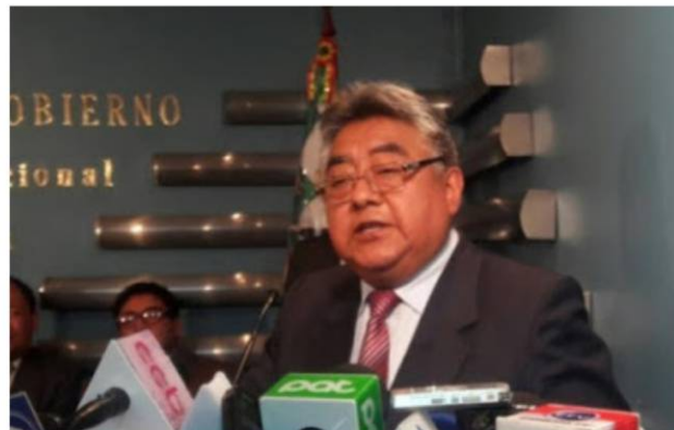
Dr. Rodolfo Illanes Alvarado, Vice Ministro de Interior del Estado Plurinacional de Bolivia

caer en provocaciones cuya frecuencia y gravedad seguramente irán en aumento a medida que Bolivia se aproxime al crucial año 2019, donde se pondrá en juego la continuidad del proceso de cambios iniciado bajo el liderazgo del Presidente Evo Morales. Provocaciones y trampas facilitadas por un entorno geopolítico que no podría ser más desfavorable: gobiernos de derecha radical en Argentina, Brasil, Paraguay, Chile y Perú; iniciativa norteamericana de reforzar "el control del narcotráfico" en la frontera Norte de la