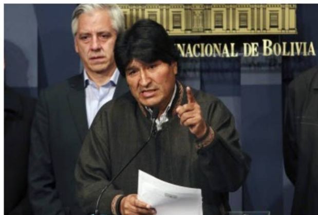
Presidente Evo Morales confirma asesinato de Vice Ministro Illanes