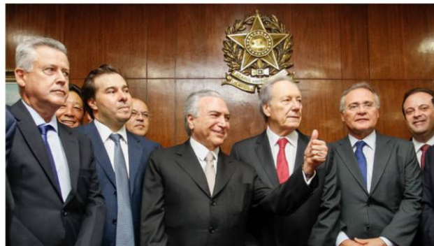
Presidente Michel Temer durante sua posse no Senado Federal.

Quando analisamos a realidade da economia brasileira nos anos recentes, percebemos, com clareza, que desde 2002 até 2014 o Brasil praticou elevados níveis de superávit primário. A instauração da crise financeira mundial de 2008, e seus desdobramentos, aliada à perda de dinamização do comércio internacional, a queda geral dos preços das commodities, os acontecimentos internos que enfraqueceram determinadamente as atividades da